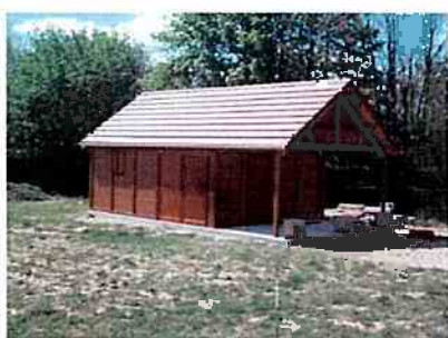
Ex : Bâtiment avec auvent considéré comme clos et couvert

Je fais construire un bâtiment non résidentiel avec panneaux photovoltaïques. Est-il possible de bénéficier pendant deux ans du tarif à 42 c€/kWh, puis de demander à bénéficier pendant les 18 ans restant du tarif intégré au bâti (58 c€/kWh ou 50 c€/kWh suivant les cas) si mes panneaux respectent les critères d'intégration au bâti ?